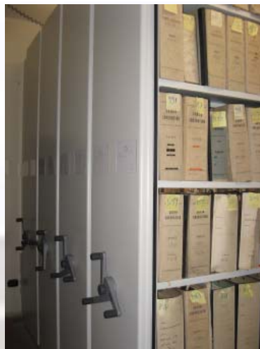
I nuovi armadi compattatori