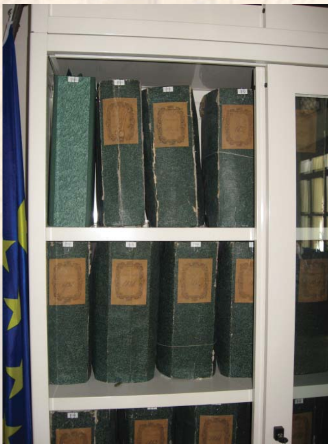
Buste contenenti documenti del Comune

nel suo insieme costituisce quindi la memoria 'necessaria' di un ente locale.